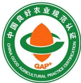
图 4 一级认证标志