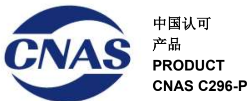
图 7 CNAS 认可标志

7.6 SRS-CNAS 联合标识（图 8）是由 SRS 认证标志和 CNAS 认可标志联合使用的一种形式。认证委托方在签署了《SRS 认证标志和 CNAS 认可标志的使用协议》后，根据协议约定内容，可合法地在其认证产品包装上使用 SRS-CNAS 联合标识。